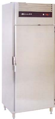
Nedkylningsskåp SC 700, kapacitet 60 – 80 kg

Accona Nedkylningsskåp är anpassade för att snabbt och effektivt kyla ner varm mat.