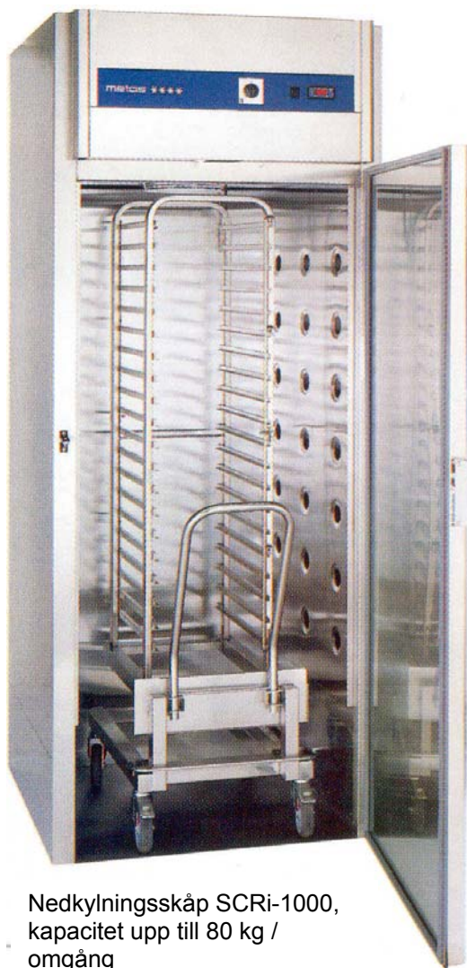
Nedkylningsskåp SCRi-1000, kapacitet upp till 80 kg / omgång