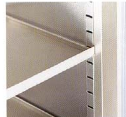
Släta rostfria hyllor, flyttbara c/c 50 mm