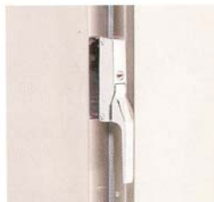
Stadigt, hållbart och låsförsett engreppshantag