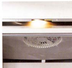
Fläkt och invändig belysning väl skyddade